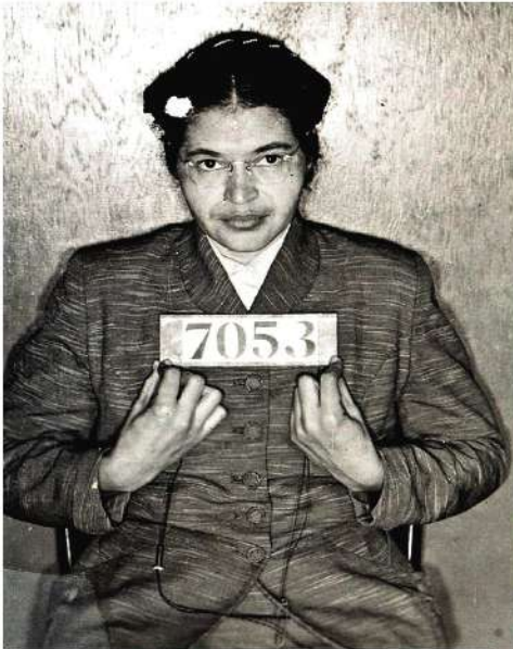
Rosa Parks lors de son arrestation