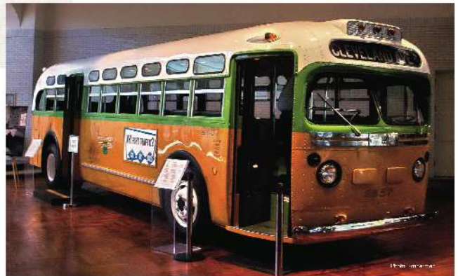
Le bus dans lequel Rosa Parks est montée le 1er décembre 1955 est maintenant exposé au Musée Henry Ford à Dearborn dans l'état du Michigan.